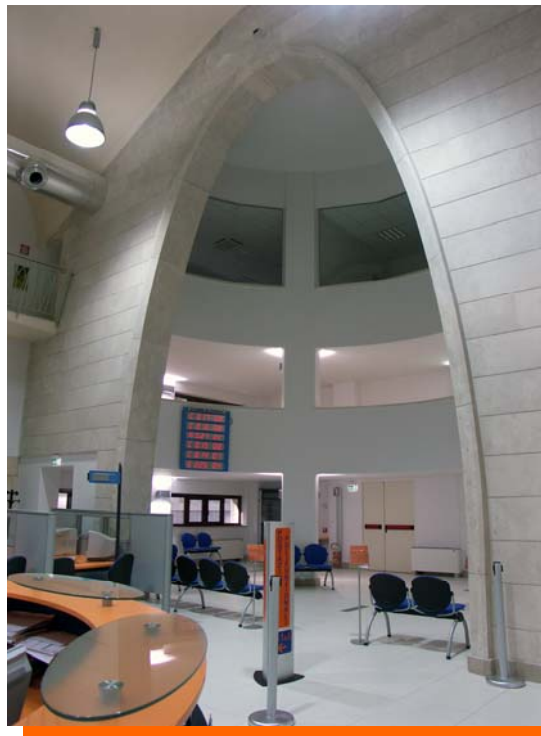
Ufficio di Napoli 2 Front-Office